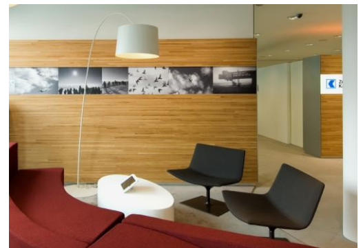
Moderne und gemütliche Lounge mit Identifikationswert.

Mehrere Besprechungsräume angrenzend an den Empfangsbereich sind für Kunden mit einem ausführlichen Informationswunsch/Beratungsbedarf vorgesehen. Der Berater und der Kunde sitzen am gleichen Tisch und auf